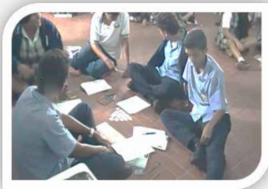
Patrones con figuras geométricas

Cabe resaltar la curiosidad que les despertó los valores contenidos en las representaciones tabulares a trabajar en esta secuencia y su verificación con la realidad. Así mismo la manera como esos valores "cambiaban" en cada situación problema fue motivo de interacción y discusión entre ellos. Con respecto a los patrones con figuras geométricas al preguntar a los estudiantes por qué ubicaron determinada figura geométrica en el paso señalado, algunos mencionaron en sus explicaciones el término "secuencia" y otros emplearon la expresión "patrón". Cuando se le preguntó al estudiante ¿Qué es un patrón? Lo definió como "una secuencia de símbolos que se repiten hasta cierto punto"; lo anterior coincide con el estándar asociado a este aprendizaje asociado al nivel de básica primaria y necesario para el estudio del concepto de función: "Identifico el patrón numérico de una secuencia y lo explico con palabras o tablas" MEN (2002).