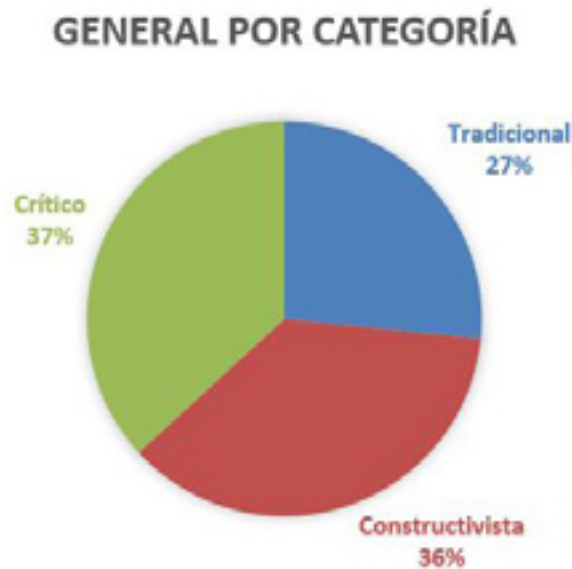
Figura 2. Resultados generales encuesta modelos pedagógicos general por categoría.

En tal sentido, la estadística evidencia que según las encuestas los estudiantes, tienen la percepción de que la institución se orienta bajo el modelo pedagógico crítico (37%), pero muy seguido de cerca del modelo constructivista (36%) y por último el modelo tradicional (27%), (Véase Figura 2).