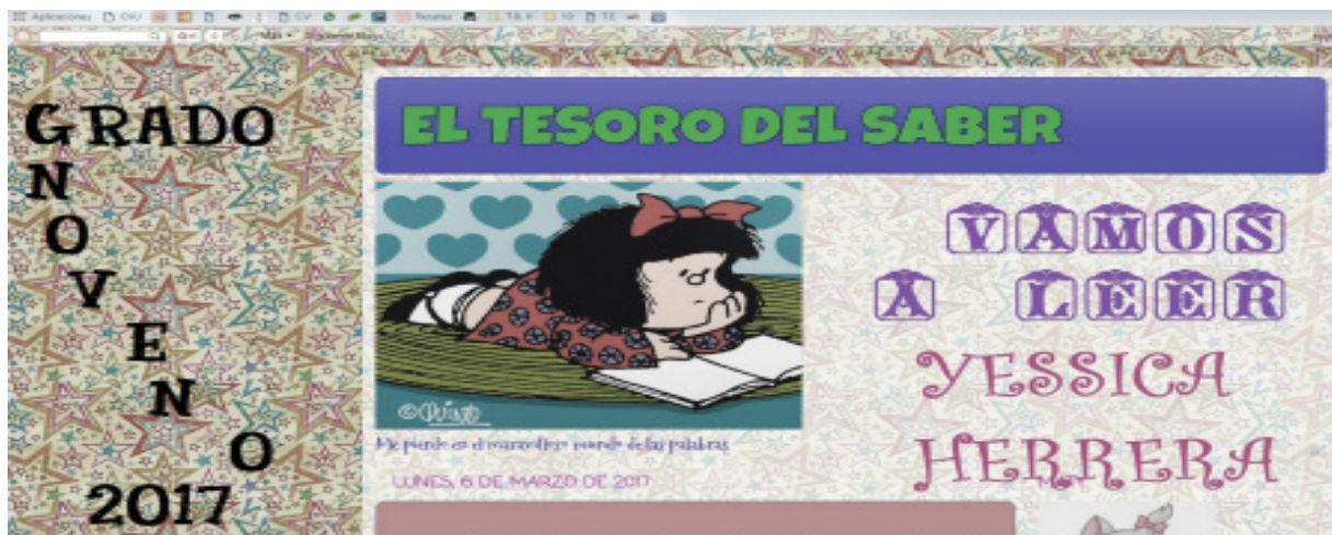
Figura 3. Imagen perfil personalizado en el curso virtual

Posteriormente cada estudiante personalizó su perfil teniendo en cuenta sus gustos, algunos estudiantes más inquietos exploraron las actividades siguientes, generando curiosidad. Esta actividad tuvo incidencia en la perspectiva de los estudiantes hacia la lectura, pues hasta el momento era concebida como un ejercicio monótono e impuesto por los docentes en sus clases, al finalizar todos querían saber cuándo era el próximo encuentro para desarrollar actividades del curso.