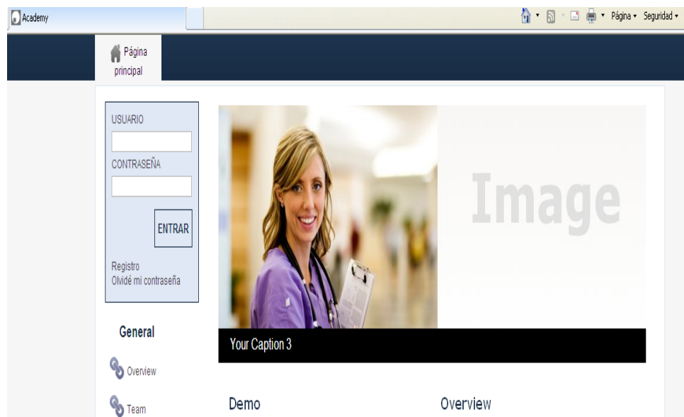
Imagen N° 1: Plataforma Aula Virtual Campus Dokeos

través de un Foro Virtual, el cual fue denominado “Comunicación Tecnológica Actual”, mediante la plataforma de Campus Dokeos).