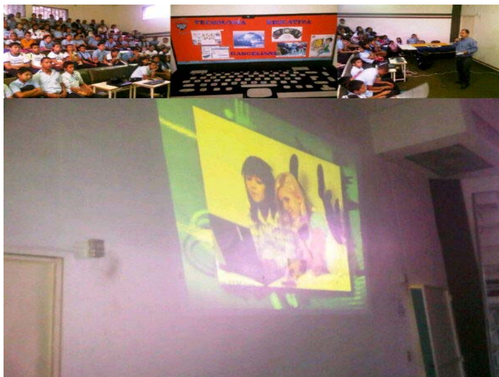
Imagen N° 3: I Presentación Tecnológica Educativa Rangeliana

Proyecto, planificaron la I Presentación Tecnológica Educativa Comunitaria, cuyo propósito es despertar al contexto estudiantil rangeliano en relación a las temáticas abordadas (Uso Doméstico del Internet, Realidades de los Cyber, Uso de Dispositivos Móviles y Hábitos de Estudio en el uso del Internet).