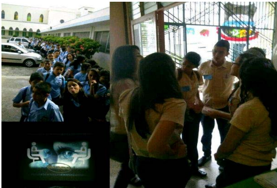
Imagen N° 4: I Presentación Tecnológica Educativa Salesiana

encontrar información actual u opciones interactivas que invitan a la sensibilización en el uso de la tecnología.