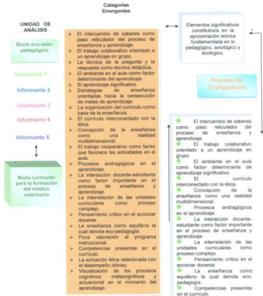
Figura 1. Estructuración General Interpretativa de la Reducción de Matrices y el Proceso de Triangulación