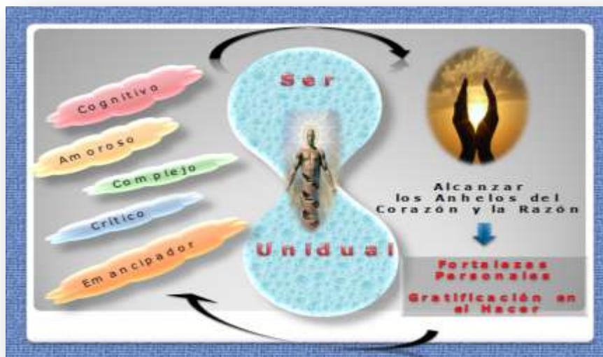
Gráfico 2. Dimensión Ontológica de Hacer del Servicio Comunitario en los estudiantes de Educación Especial. Autor.

De allí, que los sentimientos se presentan como la voluntad que motiva la acción, la cual permite determinar la meta a alcanzar. Disponer de una motivación profunda en la significancia del hacer, conlleva a la realización intrínseca, bienestar y transformación de la realidad vivida.