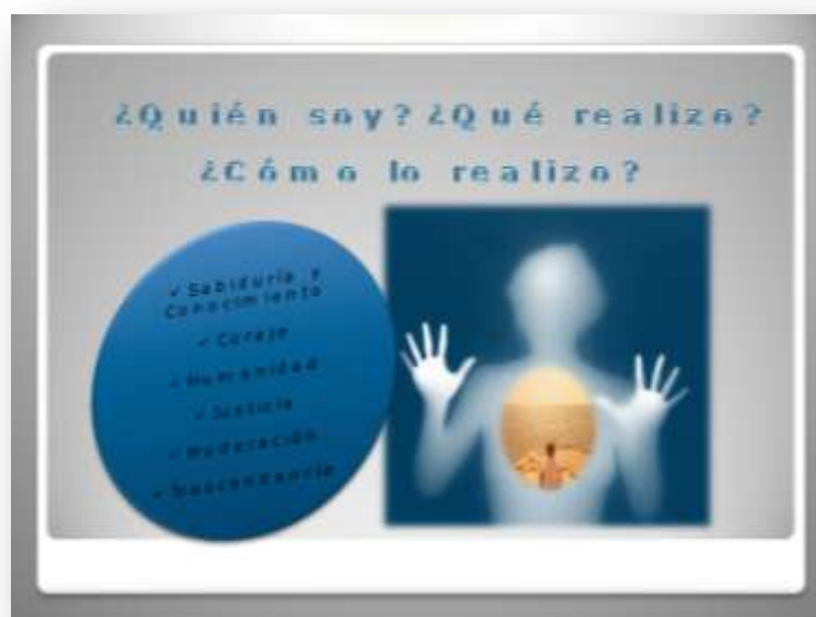
Gráfico 3. Dimensión Axiológica de Hacer del Servicio Comunitario en los estudiantes de Educación Especial. Autor.

Trascendencia , fortalezas que realzan la significación por lo que se hace, implican la apreciación por la belleza y la excelencia, gratitud, sentido del humor y espiritualidad, pensar que existe un propósito o un significado universal en las cosas que ocurren en el mundo y en la propia existencia.