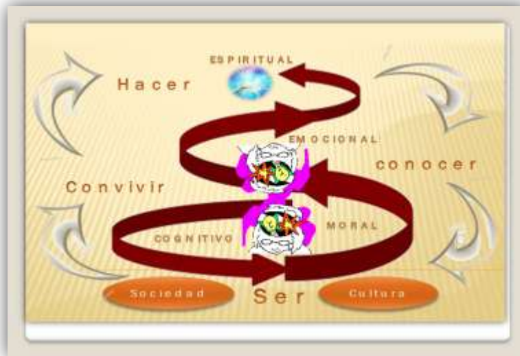
Gráfico 4. Dinámica Gnoseológica de Hacer del Servicio Comunitario en los Estudiantes de Educación Especial. Autor.

problemas con la unicidad de valores y virtudes personales y sobre todo aprender a ser, vislumbrando y sembrando la paz.