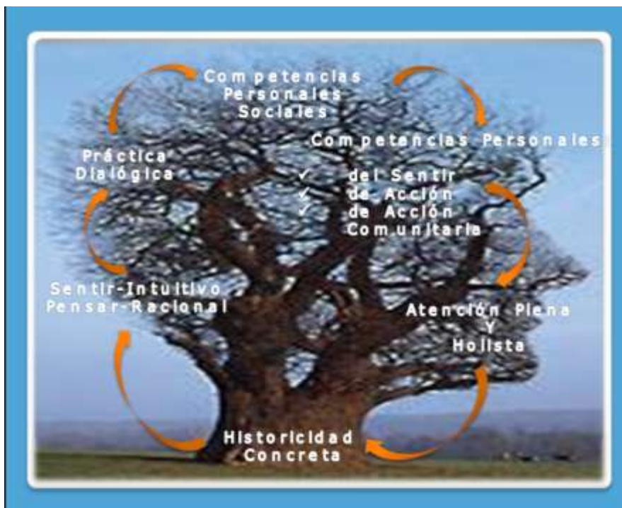
Gráfico 5. Dimensión Pedagógica de Hacer del Servicio Comunitario en los Estudiantes de Educación Especial. Autor.

Fundamentada esta aproximación teórica paradigmática es posible interrogarse, finalmente, ¿cuál debe ser la formación académica del docente en formación inicial en Educación Especial para la labor social del servicio comunitario? A la luz del hacer universitario, debe concebirse como una función inherente a lo académico, que involucra la investigación y extensión, con la finalidad de promover en el estudiante las potencialidades, habilidades y actitudes tendientes al bien común y al bienestar social.