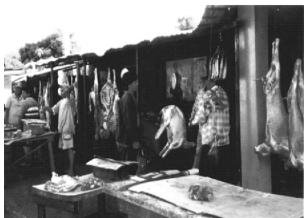
Fotografía 1. Mercado de Acera. Barrios: El Mamón y Rafito Villalobos.