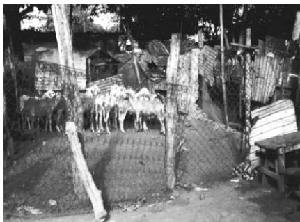
Fotografía 2. Corral Urbano de Ganado caprino y bovino.

Otro corral, denominado de mayor extensión se caracteriza por poseer entre veinte a cuarenta animales, y se encarga de la cría, engorde y sacrificio del ganado para ser comercializado en los diferentes mercados de acera y en restaurantes localizados en la zona. Su comercialización se efectúa al mayor. Estos corrales se localizan, en barrios ubicados al noreste de la parroquia, objeto de estudio. Entre ellos: San Juan, Palo Negro, Etnia Guajira, Las Peonías y Bella Esperanza.