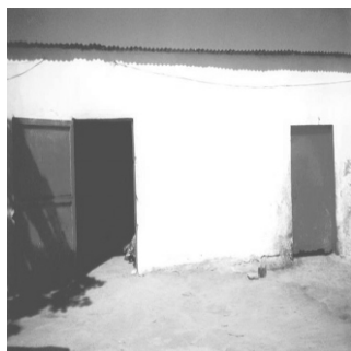
Depósito de cuero: Ganado caprino y bovino.