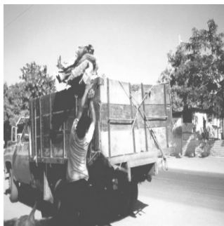
Transportista intermediario. Barrio Rafito Villalobos

En la actividad económica de comercialización del cuero participan en un 75% dueños alijunas y un 25% indígena Wayuú. Un 50% se representa con los dueños de Hatos, situados en lo que en la actualidad, se corresponde con los barrios Cardonal, (Hato Quintero) y Las Peonías (Hato Villalobos). El 25% se establece con un Alijuna que incorpora la actividad comercial por afinidad con la población indígena Wayuú, localizado en el barrio Ajonjolí.