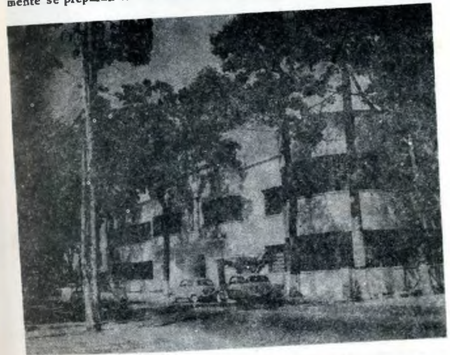
Fachada del Instituto Pedagógico de Caracas

Vayan estas palabras, hijas del recuerdo y el afecto, como dedicatoria, y sirvan de aliento a los futuros profesores que actualmente se preparan en sus aulas.