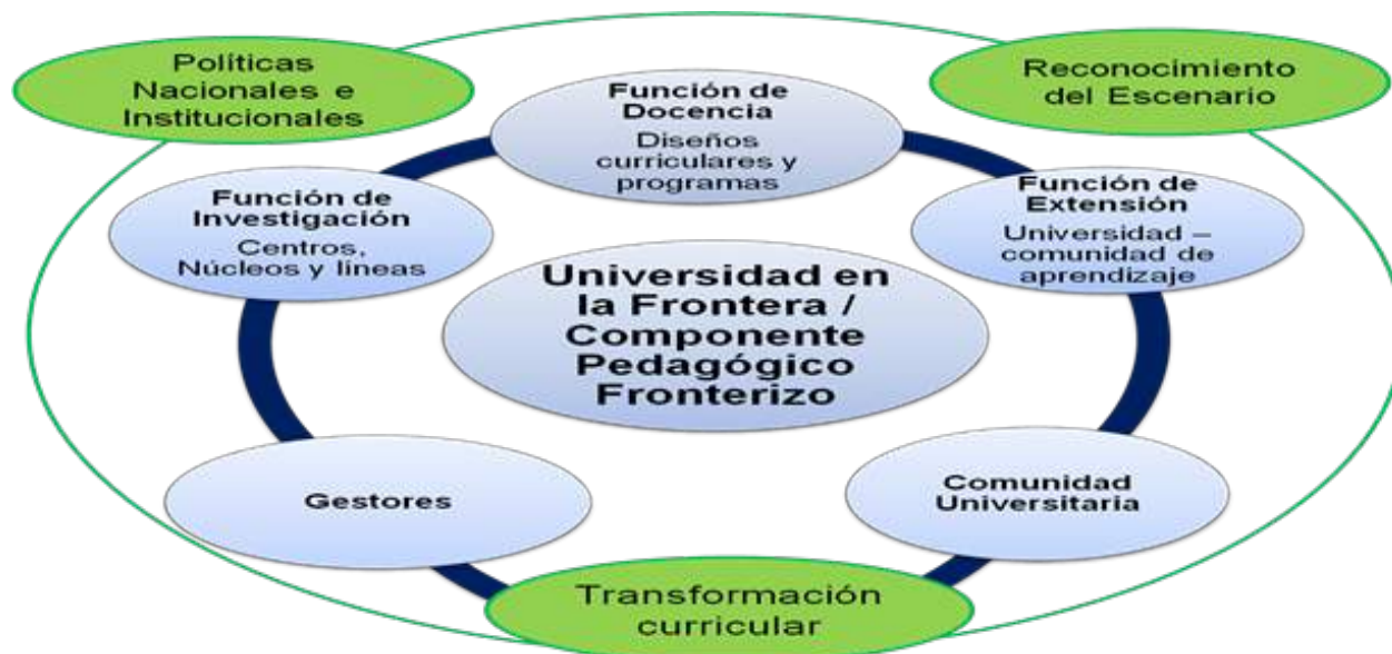
Figura 2. Funciones sustantivas y el Componente pedagógico fronterizo

Estas cinco unidades para su estudio deben tener en cuenta tres elementos fundamentales al momento de consolidar la construcción, en primer lugar el reconocimiento espacial para la contextualización de la formación académica de los estudiantes universitarios; como segundo las políticas nacionales y las normativas institucionales que amparen su vialidad y tercero la transformación curricular universitaria que en estos momentos apunta a currículos por competencias que pueden plantearse para transformar la visión social, científica y humanística de los diseños curriculares en Venezuela y en los países con frontera como el caso colombo- venezolano. (ver figura 2.)