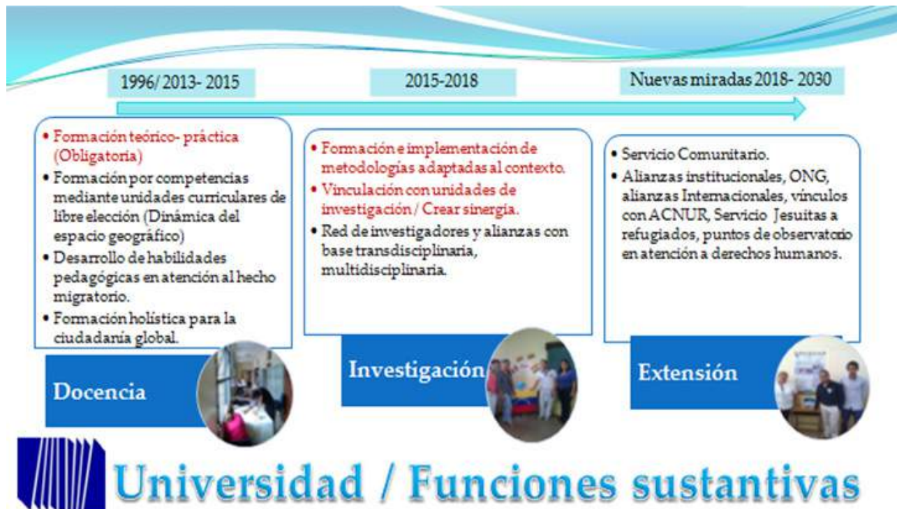
Figura 3. Logros y retos en las funciones sustantivas

(política, institucional, social, económica, ecológica, tecnológica, humana) en la figura 3 se observa el resumen.