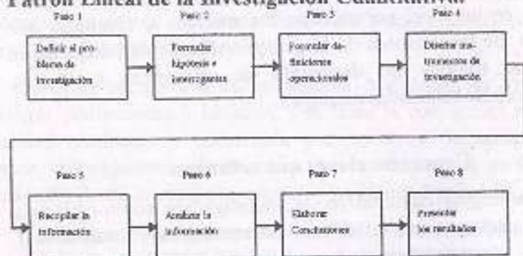
Gráfico 1 Patrón Lineal de la Investigación Cuantitativa.

Fuente: James P. Spradley (1980). "Observación Participante". New York: Rinehart and Winston.