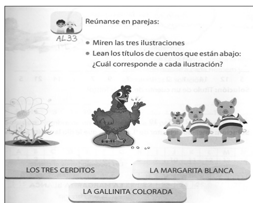
Figura 2. Actividad de Lectura 33.