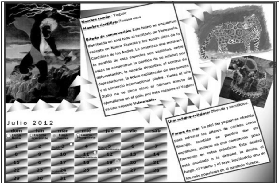
Gráfico 4. Modelo de calendario del mes de julio.