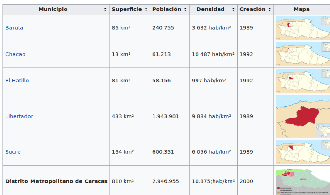
Tabla 1 Características demográficas de los municipios

En términos de las políticas para la formación ocupacional o la inserción a la vida productiva de los jóvenes, la Alcaldía Mayor ha formulado un plan de gestión titulado 2020 , del cual cabe citar la propuesta de acción Transformando a Caracas en una ciudad productiva , mediante la cual: