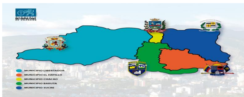
Gráfico 1. Mapa del Distrito Metropolitano de Caracas (DMC)

De acuerdo con la información disponible en el portal Wikipedia 1 (2016): “El Distrito Metropolitano de Caracas (DMC) o "Área Metropolitana de Caracas" (AMC) es el nombre que recibe el órgano político-administrativo que coordina el funcionamiento de la ciudad de Caracas a través de la Alcaldía Mayor de Caracas, esta es una forma de tener el control de la ciudad completa a través de un solo alcalde, ya que la ciudad está conformada por 5 municipios que tienen sus respectivos alcaldes. El DMC tiene una población de alrededor 3.000.000 de habitantes (INE, 2015). En el gráfico 1 se puede apreciar la ubicación físico territorial del distrito: