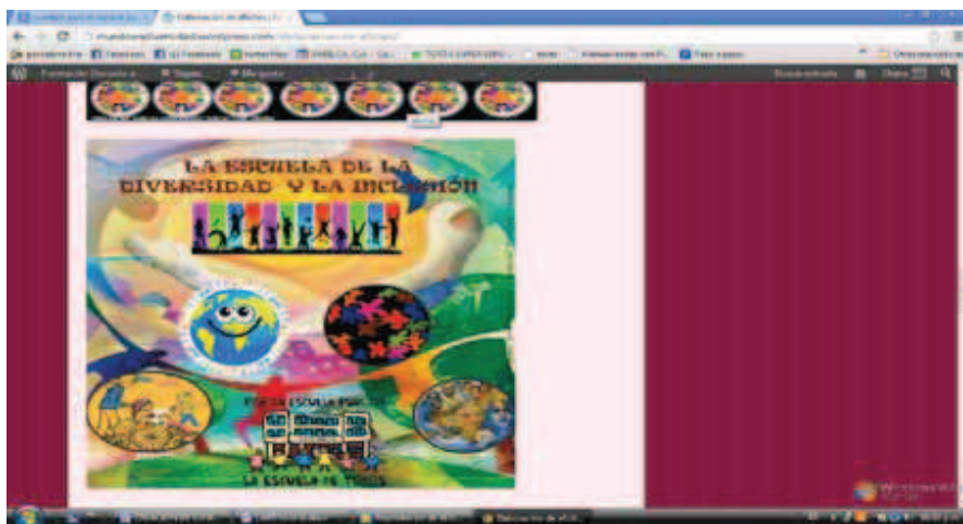
Gráfico 4. Afiche elaborado por los docentes 3 y 5. Temática "Respetando las diferencias"

En el gráfico 4, se puede apreciar otro de los afiches elaborados por el segundo grupo de participantes, el cual se relaciona con la temática: "Respetando las diferencias" con un comentario emitido por un representante de ese grupo.