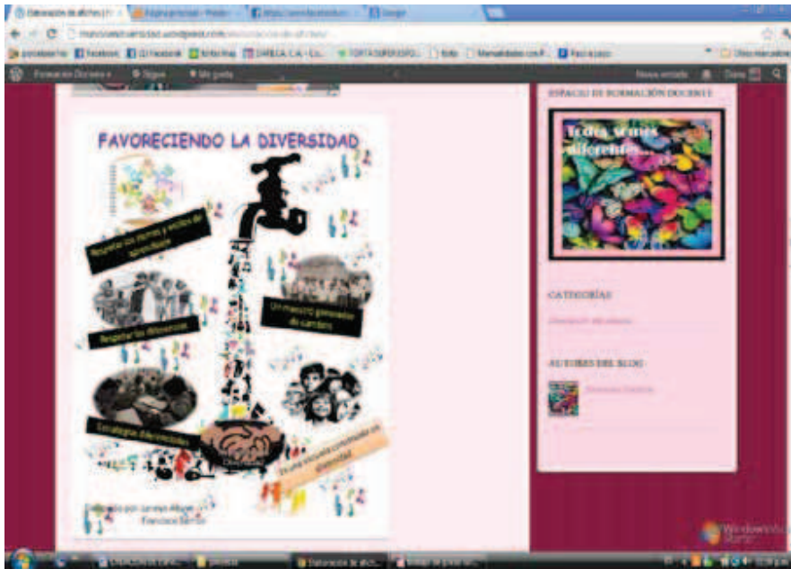
Gráfico 3. Afiche elaboración por un primer grupo de participantes. Temática “Atención a la diversidad”.

las planificaciones que deben estar centradas en las características del grupo en particular al cual están dirigidas y los docentes deben favorecer el respeto por las diferencias.