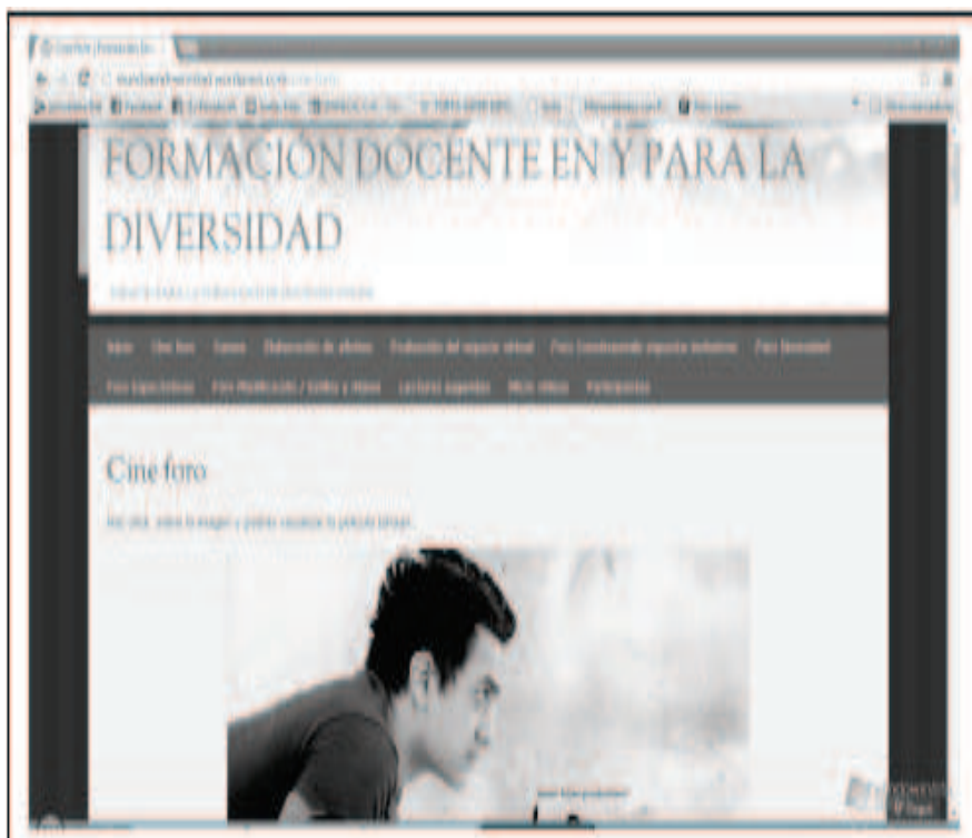
Gráfico 1. Espacio virtual: Formación Docente en y para la Atención a la Diversidad.

Momento III: consistió en la operacionalización de la propuesta. Se inició con el primer foro denominado “Expectativas” en el que los participantes dejaron sus comentarios acerca de dicho espacio.