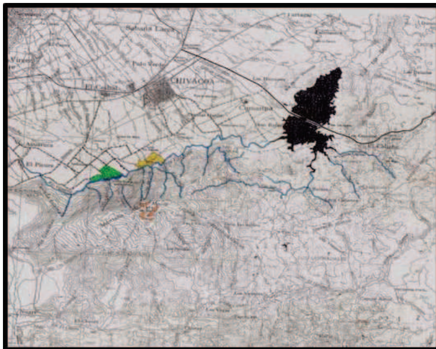
Figura 1. Localización geográfica de la zona mítica religiosa de Quibayo, Monumento Natural “Cerro María Lionza”. (Tomado de: Servicio Autónomo de Geografía y Cartografía Nacional, 1994).

Es importante resaltar que esta área protegida es uno de los atractivos turísticos del estado Yaracuy, recibiendo gran afluencia de visitantes nacionales e internacionales durante todo el año, incrementándose por las diversas actividades mágico religiosas que en ella se desarrollan, específicamente en las cercanías del 12 de octubre, cuando se conmemora el día de la resistencia indígena. Esta elevada concurrencia de visitantes es otra justificación para desarrollar diversas iniciativas educativas ambientales, en pro de garantizar su uso sustentable y permanencia en el tiempo.