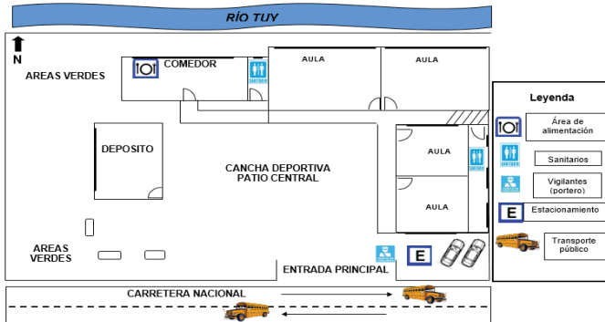
Gráfico 1b. Plano en la U.E.N. "Liceo Bolivariano Panaquire". Piso 1, 2 y 3.