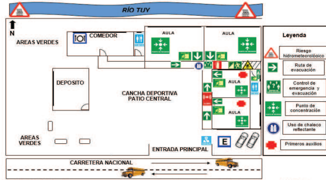
Gráfico 1d. Plano de riesgo, recursos y rutas de escape para la atención de amenazas hidrometeorológicas en la U.E.N “Liceo Bolivariano Panaquire”. Piso 1, 2 y 3.