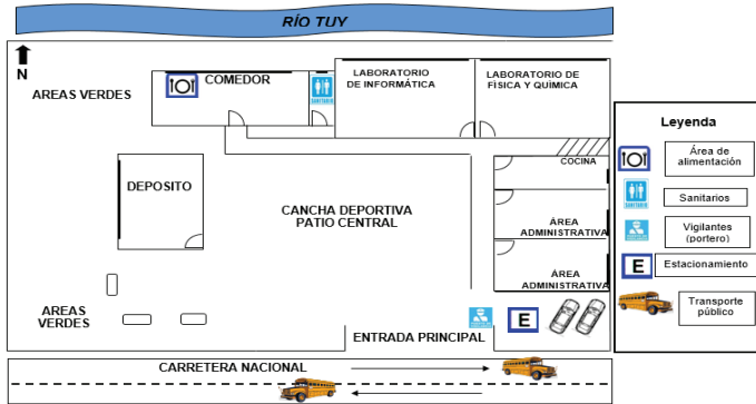
Gráfico 1a. Plano en la U.E.N. "Liceo Bolivariano Panaquire". Nivel Planta Baja.