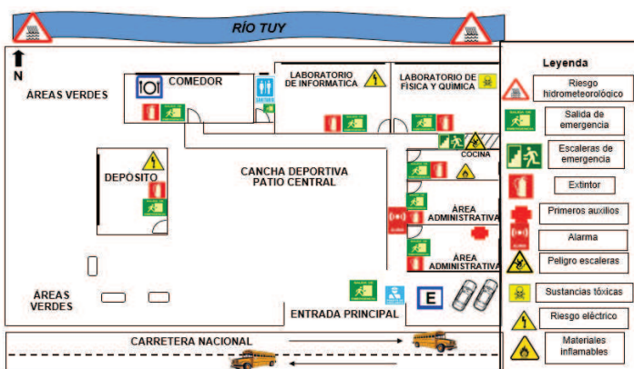
Gráfico 1c. Plano de riesgos, recursos y rutas de escape para la atención de amenazas hidrometeorológicas en la U.E.N. "Liceo Bolivariano Panaquire". Nivel PB.