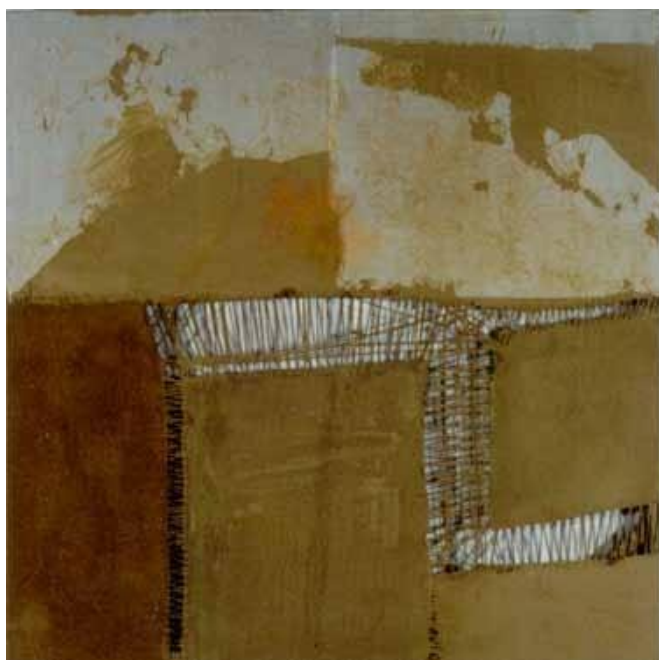
Figura 3. De la serie cosidos. (Acrílico, tierras, aglutinantes industriales, pabilo, telas y maderas). 100 x 100 cm.

En esta obra, la artista retoma la figuración dentro de la temática de la muerte, incorporando otros medios expresivos como la fotografía, el uso de elementos no convencionales como la arena, lo cual le imprimió un mayor carácter lúdico a su propuesta. En esta pieza, el sentido de la verticalidad dado por el formato de papel continuo es un recurso para sugerir la elevación del espíritu, de los cuerpos que ascienden descarnados. El blanco y el negro se combinan para dibujar las figuras de esqueletos en una relación de antagonismo que podría referir la presencia del bien y del mal en cada individuo. El sepia de fondo se confunde con el círculo de tierra, referente ineludible del sepulcro o del polvo al cual retorna el ser, pero también “un símbolo del alma y del sí mismo”. (C.G. Jung citado por Murga, 1993, p. 60). El retorcimiento de las figuras recuerda las formas de la sepultura dada por algunos pueblos indígenas a sus difuntos, quienes los colocan en vasijas funerarias y en posición fetal.