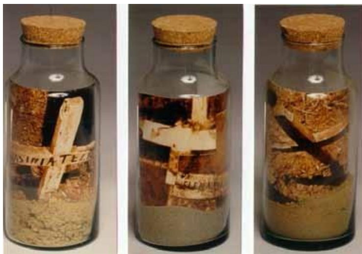
Figura 5. De la serie cosidos. (Fotografías, frascos de vidrio, corchos, arenas de playa y tierra) Medidas variables

En una de las variantes representativas de las palas, la artista incluye una en sentido opuesto al resto del conjunto, es decir, con la cara de esa pala dirigida al piso; este detalle tal vez simboliza la posibilidad latente de dejar existir, un autorretrato de la condición humana, una metáfora existencial de la cual el espectador participa. Es en esta serie en particular donde se pueden intuir las profundas reflexiones lúdicas de Gladys Medina en torno a la muerte.