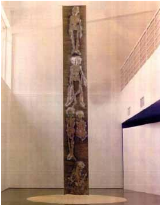
Figura 2. De la serie cosidos. Instalación realizada en el museo Jacobo Borges. (Arena de playa, papel, lápiz, carbón y sanguina). Medidas variables

El soporte de papel o tela usado por la artista en la mayoría de su obra, se ve modificado por el impulso creador que la lleva a realizar instalaciones artísticas contemporáneas, como la expuesta en el museo “Jacobo Borges”, la cual se observa desde diferentes niveles espaciales (ver figura 2).