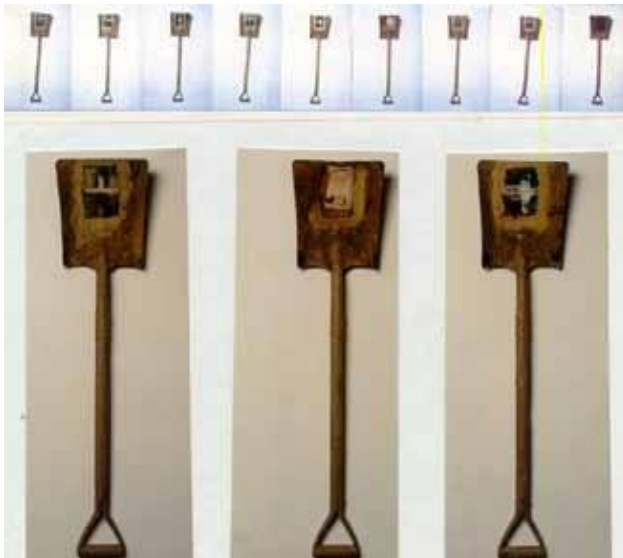
Figura 4. De la serie cosidos. (Palas, fotografías, tierras, aglutinantes industriales, acrílicos) Medidas variables

Estas creaciones, en palabras del artista, aluden a la costura practicada a los muertos después de la autopsia, además, los planos de telas pigmentadas con ocre sugieren los campos desérticos de los llanos, o las paredes añejas de las ruinas construidas con bahareque, o cualquier ámbito que recree el espectador en el devenir de su mirada.