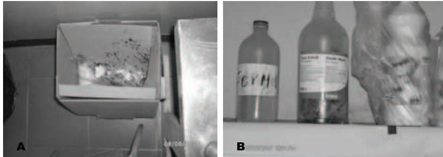
Figura 3. Cajas de seguridad para objetos punzo-cortantes ensambladas inadecuadamente (A) y disposición en recipientes sin normas de seguridad correspondientes (B). Complejo Hospitalario Universitario “Ruiz y Páez”, Ciudad Bolívar, estado Bolívar.

Para disminuir, al máximo, estos riesgos de infecciones, es necesario cuidar cada una de las etapas en el sistema de segregación y disposición final de los desechos, iniciando por la clasificación de los mismos, puesto que una segregación inadecuada no sólo pone en riesgo la salud, sino también eleva considerablemente los costos de manejo de residuos, por estar aplicando un tratamiento de desinfección y esterilización a grandes cantidades, cuando sólo una pequeña porción lo requiere, esto debido a que los desechos comunes (Tipo A), son considerados potencialmente peligrosos (Tipo B) al entrar en contacto con los desechos infecto-contagiosos (Tipo C), requiriendo en este momento un tratamiento de esterilización.