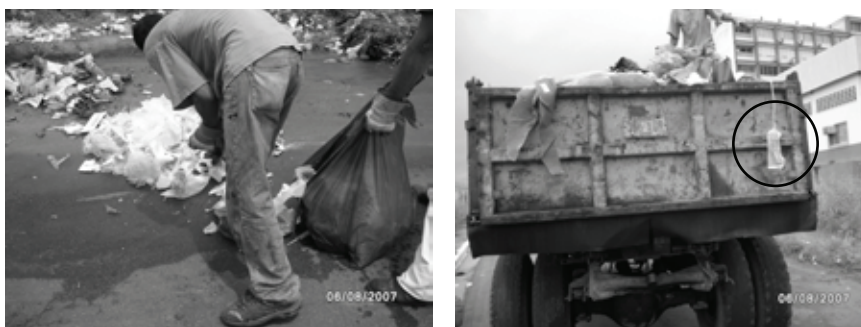
Figura 2. Personal encargado de la recolección final de los desechos sólidos (A) y unidad vehicular contratada para su transporte hacia el relleno sanitario (B). Complejo Hospitalario Universitario "Ruiz y Páez", Ciudad Bolívar, estado Bolívar. Destáquese los restos de desechos médicos que sobresalen del vehículo

Vale destacar, que al no contar con un medio de transporte externo propio, la municipalidad debe valerse del contrato de unidades vehiculares que, además de no cumplir con las normas de bioseguridad básicas, son conducidos por personal no entrenado (ver figura 2).