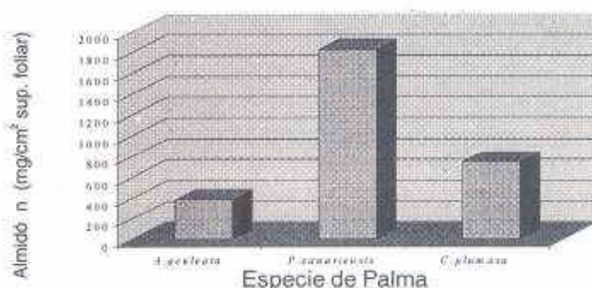
Gráfico 2. Contenido de almidón por especie de palma

El gráfico 2 ilustra el orden en el contenido de almidón obtenido por especie de palma.