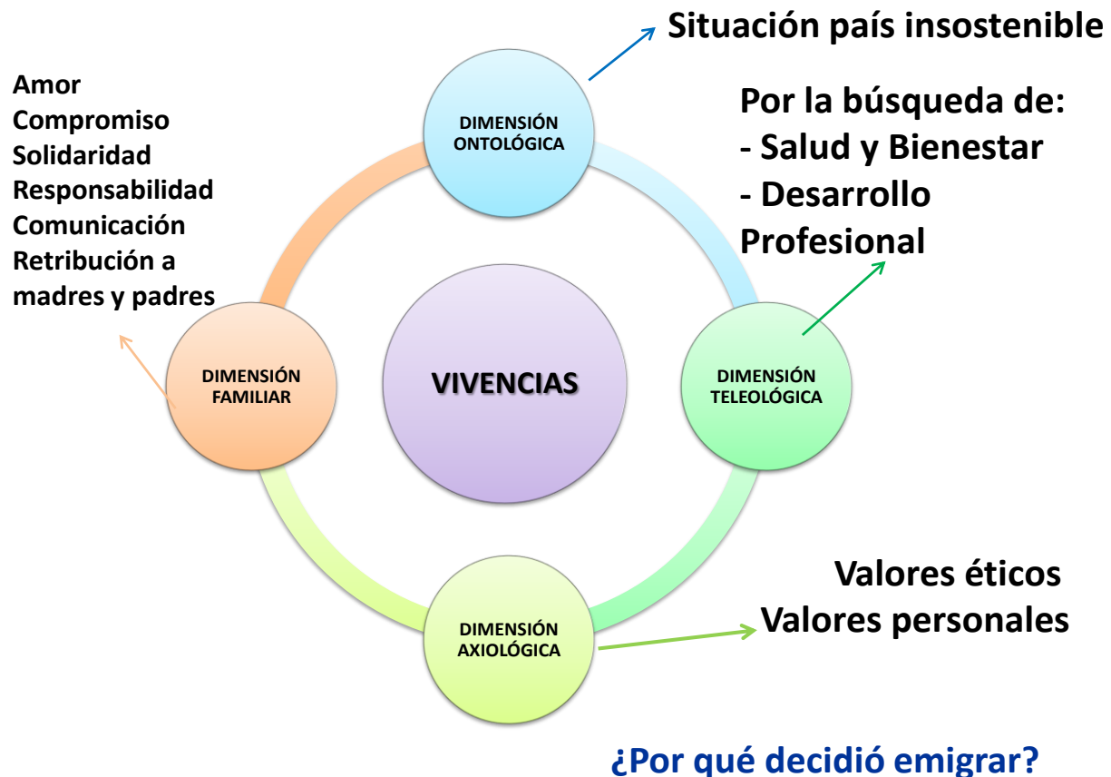
Gráfico 1. ¿Por qué decidió emigrar?

primarias personales y familiares (alimentación, medicinas, educación, recreación, vestidos, servicios de salud). Asimismo, se evidencia lo axiológico mediante los valores y actitudes (amor, compromiso, solidaridad, responsabilidad, comunicación y la retribución a madres y padres) expresados en los siguientes testimonios: “Partí para formar una familia con mi pareja y tener mejor calidad de vida...” (Inf.7);“...otras condiciones económicas que, me permitieran ayudar a mi familia que está en Venezuela...” (Inf.8); “Imposibilidad de mi hija de acceso a estudios superiores...”(Inf.5). (Gráfico 1).