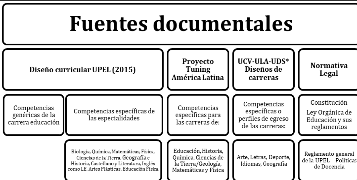
Gráfico 1. Fuentes documentales de información. Tomado de: Vásquez y La Rosa, (2020). Universidad Central de Venezuela-Universidad de los Andes-Universidad Deportiva del Sur.

Para desarrollar la investigación se emplearon técnicas e instrumentos propios del tipo de investigación, la observación documental que para Vásquez (2015) como "...una técnica que permite procesar toda la información de fuente escrita que versa sobre el tema investigado..." (p.142). También se aplicó el análisis de contenido, que según Ruiz (2013 "se basa en la lectura como instrumento de recogida de información, lectura que debe hacerse de modo científico, es decir de manera sistemática, objetiva, replicable, válida." (p.193). Como instrumentos se utilizaron, en primer lugar, un guión de observación, así como diversas matrices de análisis de contenido para procesar la información obtenida de las diversas fuentes documentales procesadas. Cada fuente generó una matriz y todas generaron una matriz consolidada.